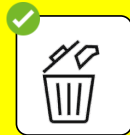
Reinigungsmaterial in geschlossenen Mülleimern entsorgen