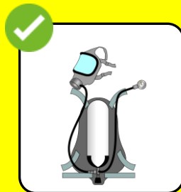
Einsatzmaterial reinigen / desinfizieren