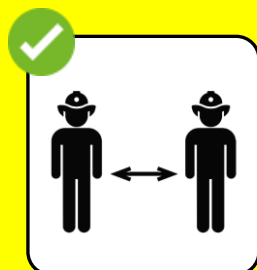
Stets den Abstand halten (z.B. auf dem Sammelplatz).