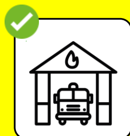
Aufenthalt im Feuerwehr-Magazin nur mit klarem Auftrag