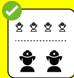
Minimum an Personal einsetzen.