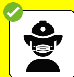
Hygienemasken tragen, wenn 2 Meter Abstand mehr als 15 Minuten nicht möglich ist.