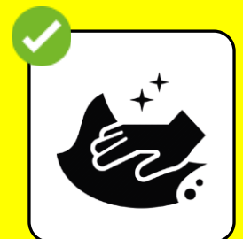
Ausrüstung gemäss Vorgaben retablieren.