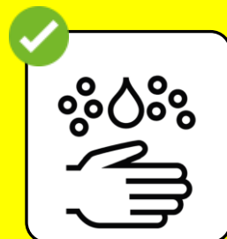
Beim Eintreten die Hände waschen