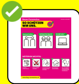
Regeln des BAG einhalten.